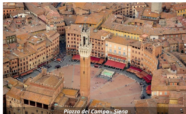
Piazza del Campo - Siena

Jantar livre [não incluso] e pernoite em hotel em Portovenere, ou arredores.