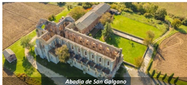
Abadia de San Galgano

redenção de seus pecados, fincou com força sua espada na rocha e jurou o fim de sua devassidão criminoso, para se dedicar à causa cristã até o fim de seus dias. Essa incrível história foi ganhando enorme fama tanto na Itália como na Europa e, para muitos historiadores e literatos, seria a própria origem do mito de Lancelot e do Rei Artur, mantendo intacto o relato da espada em forma de cruz fincada na rocha.