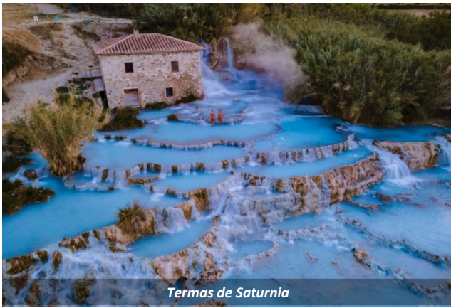
Termas de Saturnia

À tarde, seguiremos para as Termas de Saturnia , o principal complexo termal da Itália e um dos mais extensos da Europa. Por milênios, ininterruptamente, a água sulfurosa jorra das profundezas da terra com um ritmo de mais de 500 litros por segundo, a uma temperatura constante de 37,5 °C..