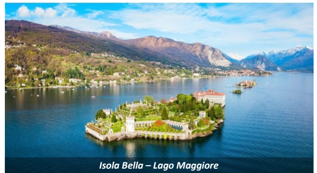
Isola Bella – Lago Maggiore