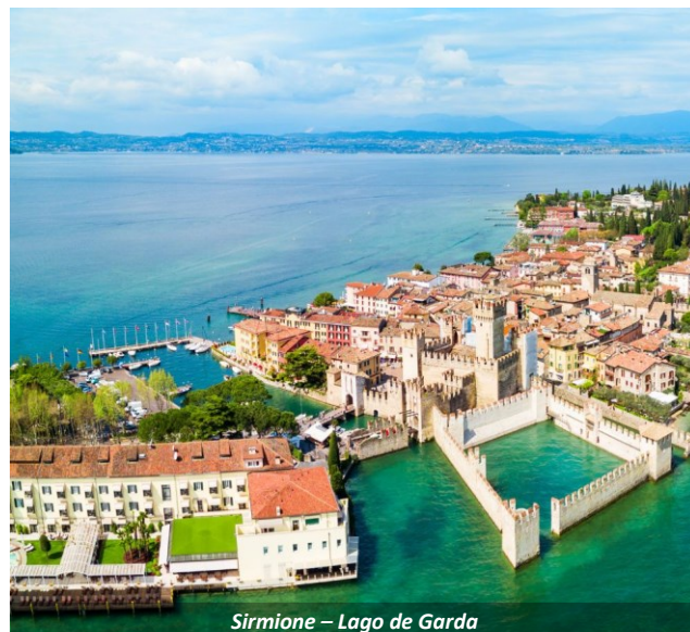
Sirmione – Lago de Garda

Com um guia especializado, caminhando por suas elegantes ruas, conheceremos o Centro Histórico de Verona , também conhecida como