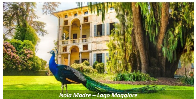
Isola Madre – Lago Maggiore