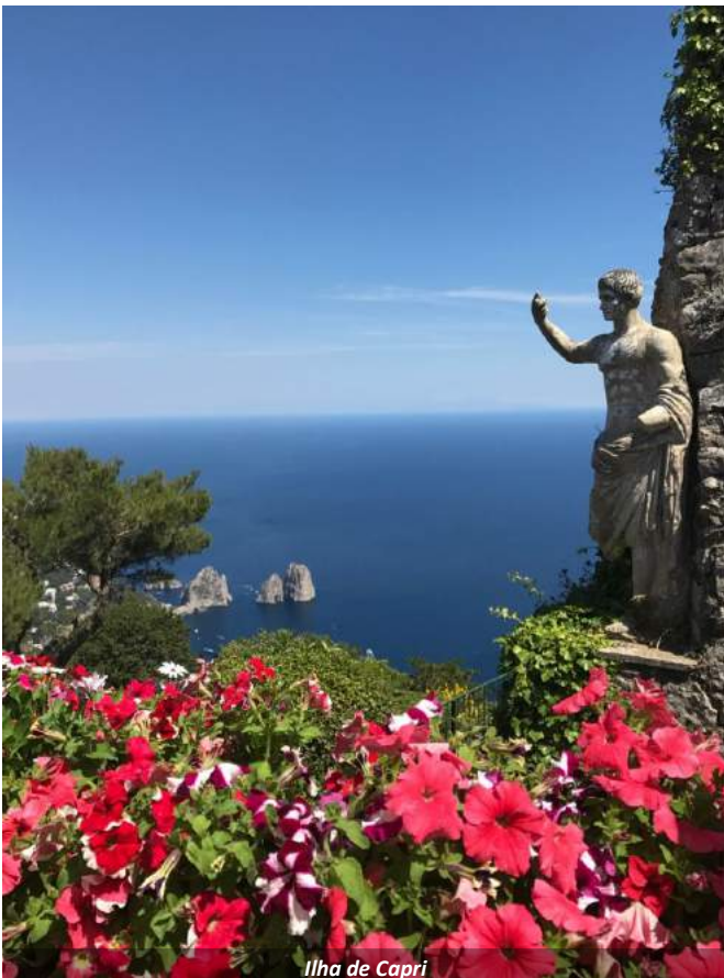
Ilha de Capri

Pernoite em hotel em Salerno [jantar não incluso].