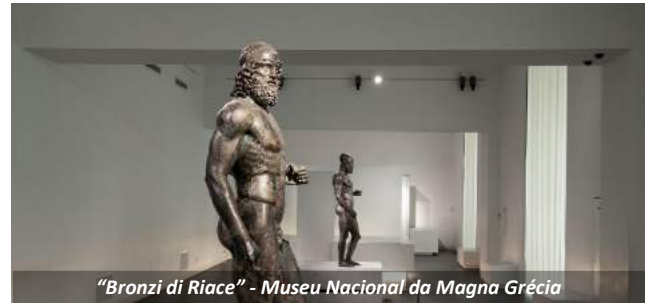
"Bronzi di Riace" - Museu Nacional da Magna Grécia

Visitaremos, com um guia especializado, o Museu Nacional da Magna Grécia [ingresso incluso], um dos mais importantes museus do mundo na área de arte da colonização da