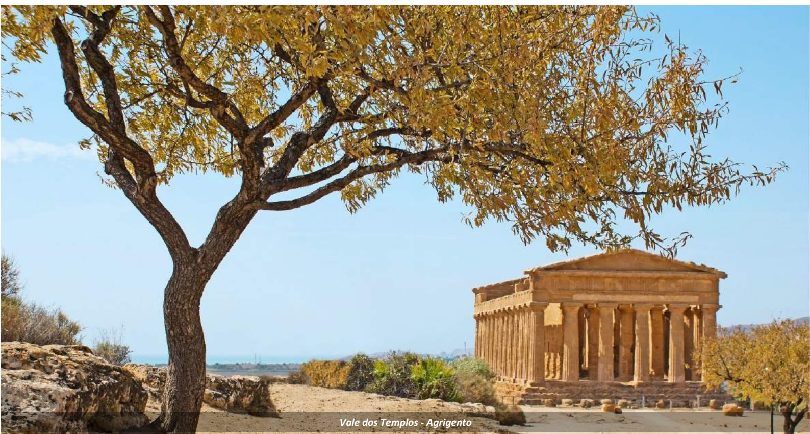
Vale dos Templos - Agrigento

Jantar [incluso] e pernoite no hotel em Agrigento.