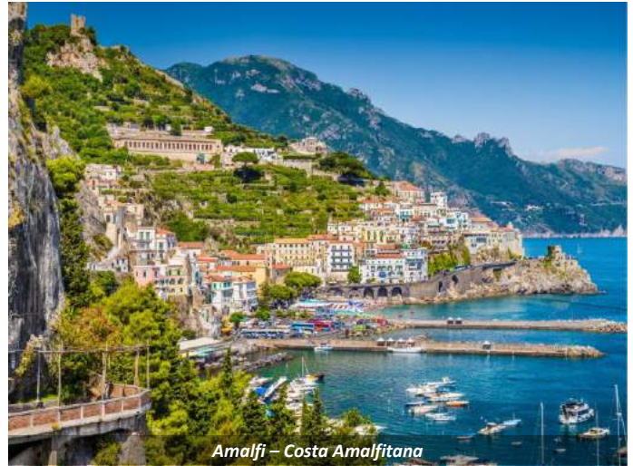
Amalfi – Costa Amalfitana

Acomodação no hotel. Jantar [incluso] e pernoite em Salerno.