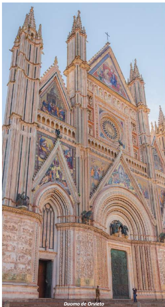
Duomo de Orvieto