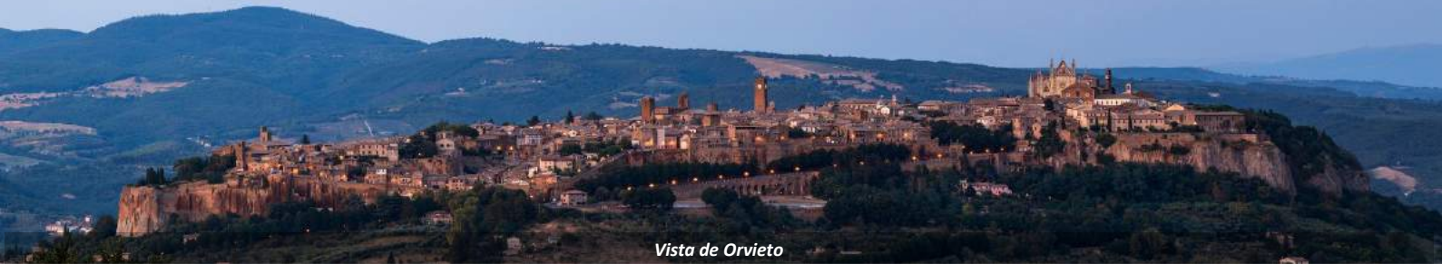
Vista de Orvieto