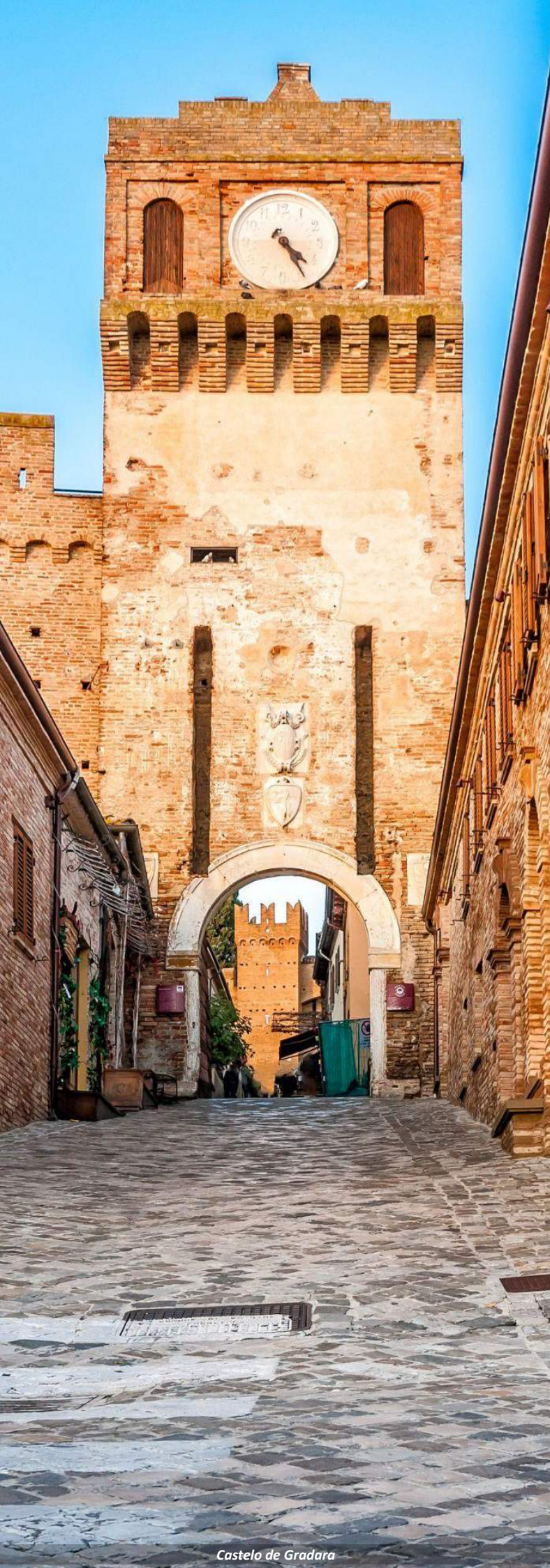
Castelo de Gradara