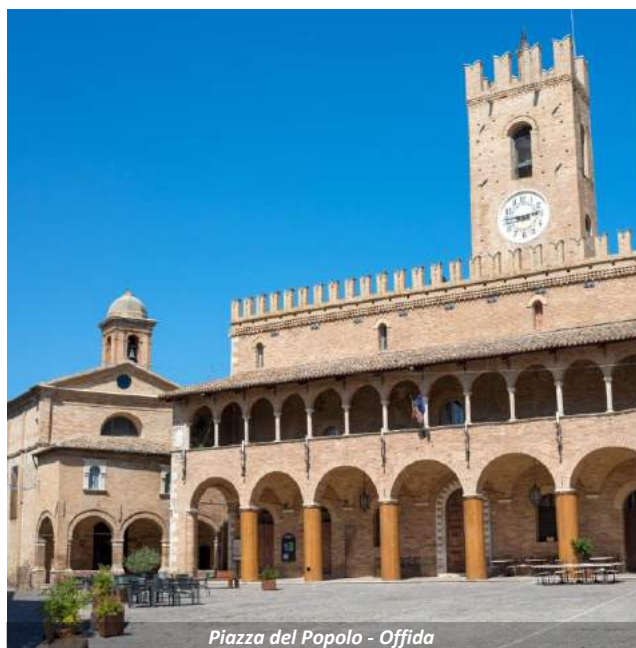
Piazza del Popolo - Offida

Acomodação e pernoite em hotel em Ascoli Piceno.