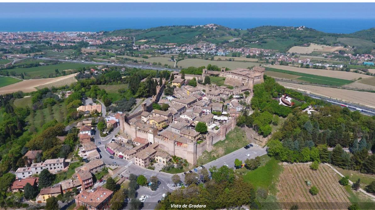
Vista de Gradara