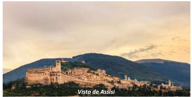
Vista de Assisi